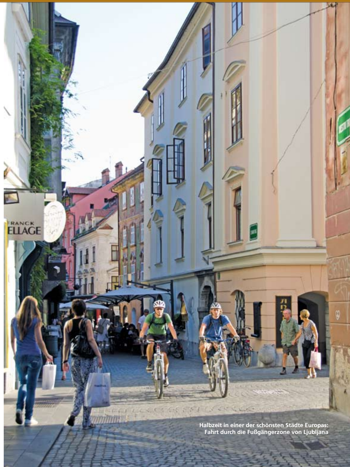
Halbzeit in einer der schönsten Städte Europas: Fahrt durch die Fußgängerzone von Ljubljana