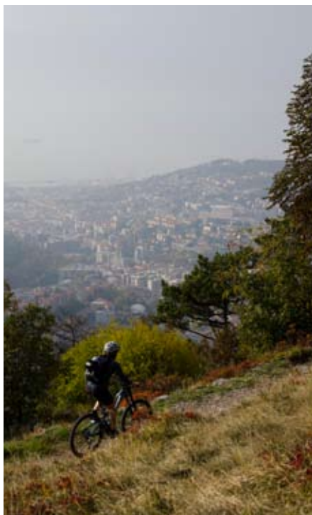
Kurz vor dem Ziel: Bick auf Triest

nuss der landestypischen Küche kommen. 45 km / ↑ 1540 hm / ↓ 920 hm