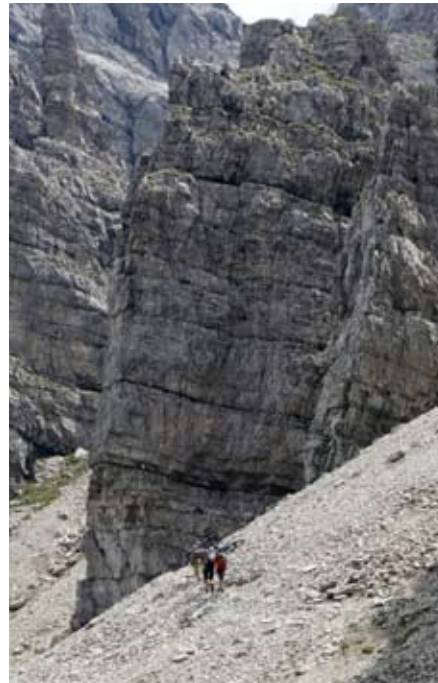
Tragestrecke durch die Felstürme der friulanischen Dolomiten