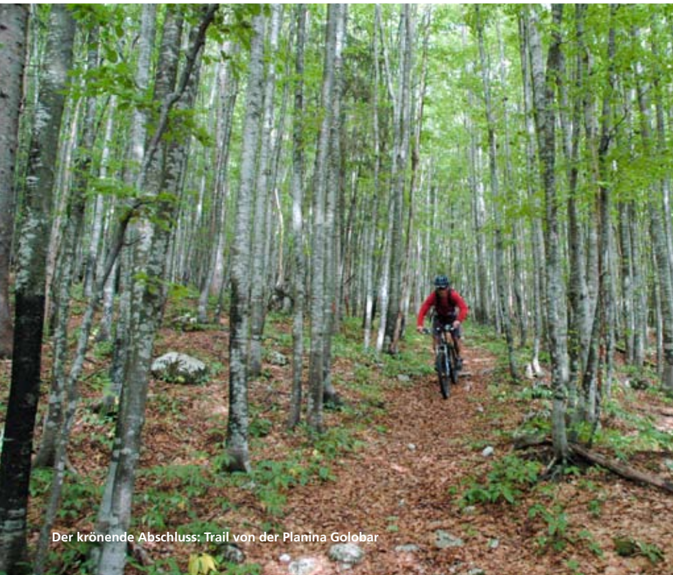
Der krönende Abschluss: Trail von der Planina Golobar

freiraus Verlag | Mountainbikereisen info@mtb-slowenien.de www.mtb-slowenien.de