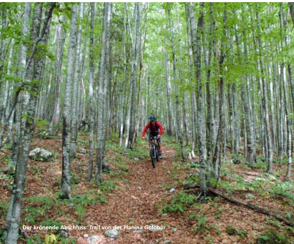
Der krönende Abschluss: Trail von der Planina Golobar