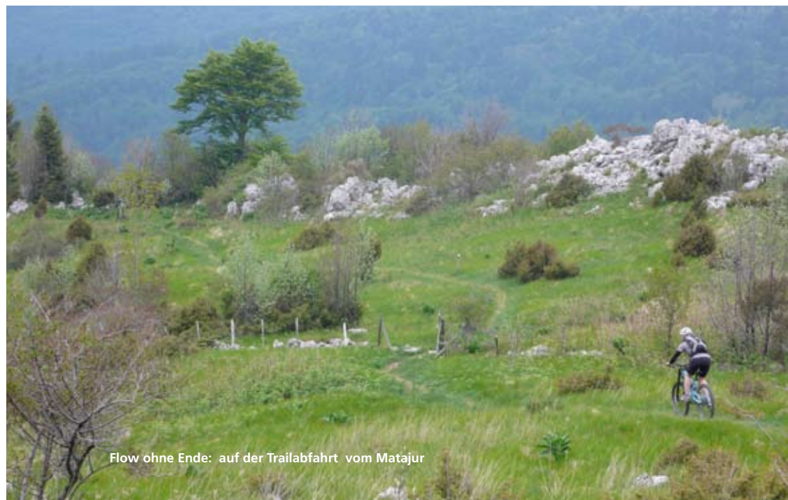
Flow ohne Ende: auf der Trailabfahrt vom Matajur

Teilnehmerzahl bei o.g. Preis mindestens 6 Personen, auf Anfrage Termine auch für kleinere Gruppen möglich!