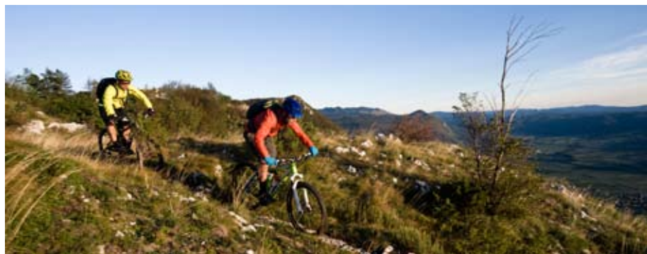
Abfahrt ins Vipava-Tal (4. Etappe)