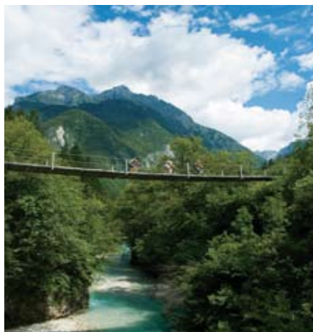
Hängebrücke im Soča-Tal (1. Etappe)

Für eine Teilnahme an dieser Tour ist eine sehr