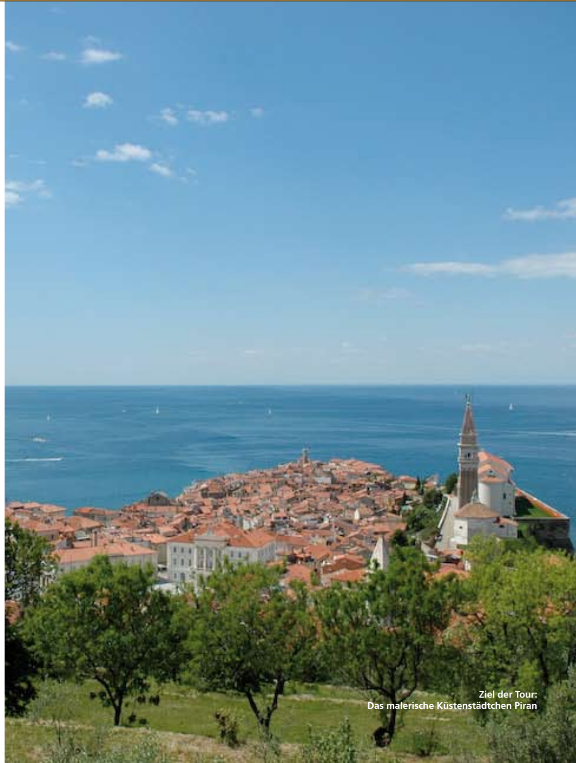
Ziel der Tour: Das malerische Küstenstädtchen Piran